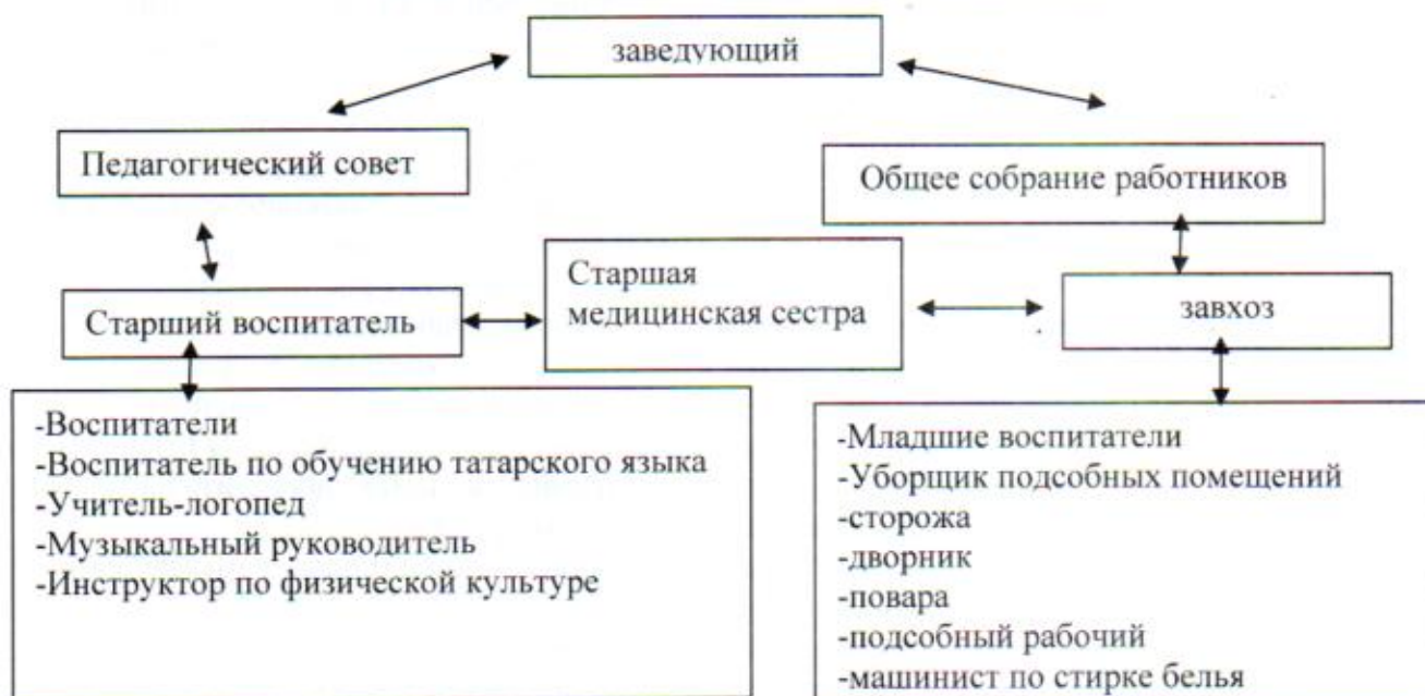
Схема управления МБДОУ «Детский сад №76»

Вывод: управление в МБДОУ «Детский сад №76» осуществляется в соответствии с действующим законодательством на основе принципов единоначалия и коллегиальности. Механизм управления обеспечивает его стабильное функционирование, взаимосвязь всех структурных подразделений. В МБДОУ «Детский сад №76» реализуется возможность участия в его управлении всех участников образовательного процесса.